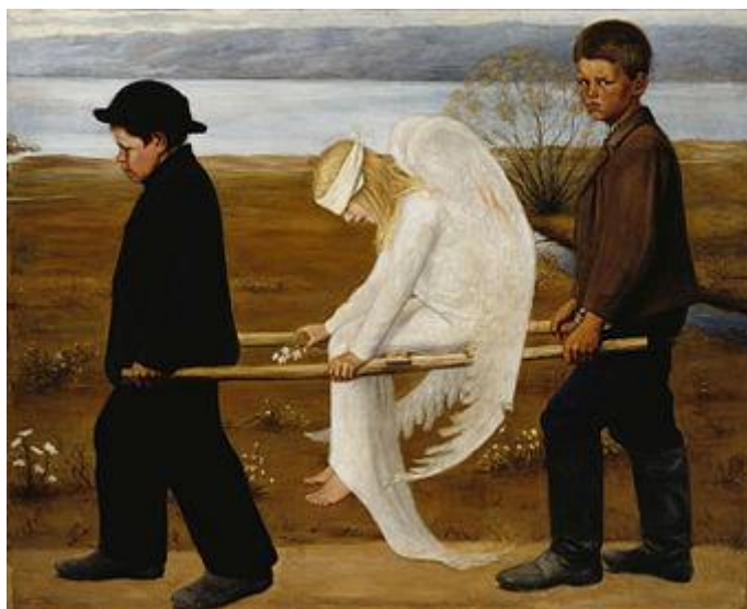
Рис. 2. Картина “Поранений янгол”

Війна створила низку перепон для сприятливих умов на шляху до реалізації процесу навчання зростаючого покоління та діяльності дорослих. Відчуття кожного та кожної з нас можна зіставити з картиною фінського художника, графіка та найбільшого представника фінського символізму Г. Сімберга (1873–1917 рр.). Вона має назву “Поранений янгол”; час створення – 1903 р. (Рис. 2). Ми – “поранені янголи”. Усі стали більш серйозними... Як досягти синергії між викладачами та учнями / студентами? Як сприяти об’єднанню зусиль між овітянською когортою під час підвищення кваліфікації, зважаючи на трагічні події?